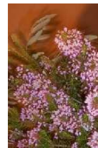
Erica dei boschi